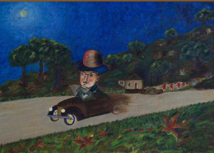
Pintura de Lélia Parreira: Pessoa ao volante do Chevrolet na Estrada de Cintra